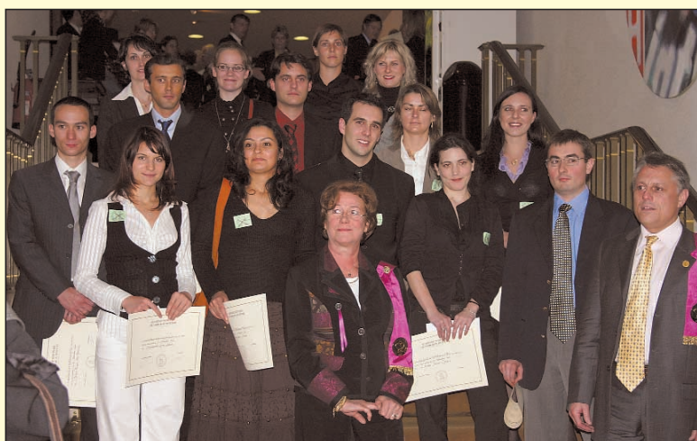
Les lauréats des prix de l'Académie Nationale de Chirurgie-Dentaire