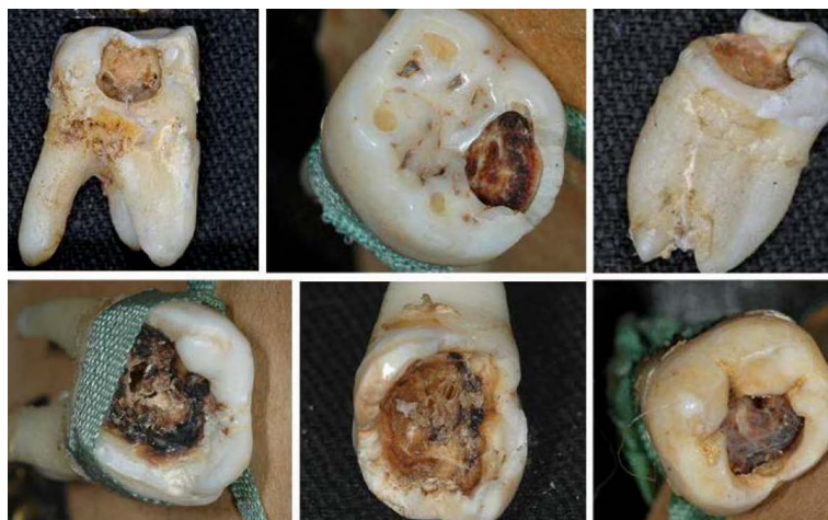
▲ Fig. 4 : Cavités cariées liées avec la pulpe.

Cependant il est difficile d'expliquer la raison de l'avulsion des 10 dents restantes, car elles n'ont pas de