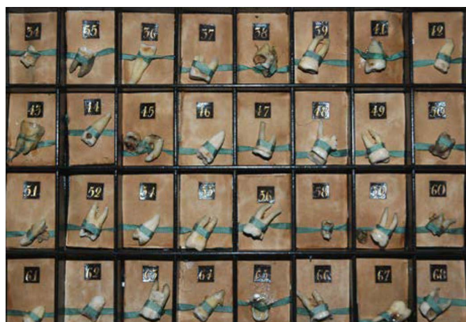
▲ Fig. 2 : La partie des réserves de musée.