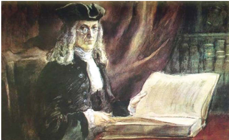
▲ Fig. 8 : Nikolas Bidloo, autoportrait (musée de l'Académie russe de la médecine militaire).

Les premiers médecins qui ont reçu leur formation en Russie sont sortis de l'école médicale de l'hôpital en mai 1712. Les quatre premiers promus, Stepan Blazhenev, Ivan Beljaev, Egor Zhukov, Ivan Orlov, ayant obtenu