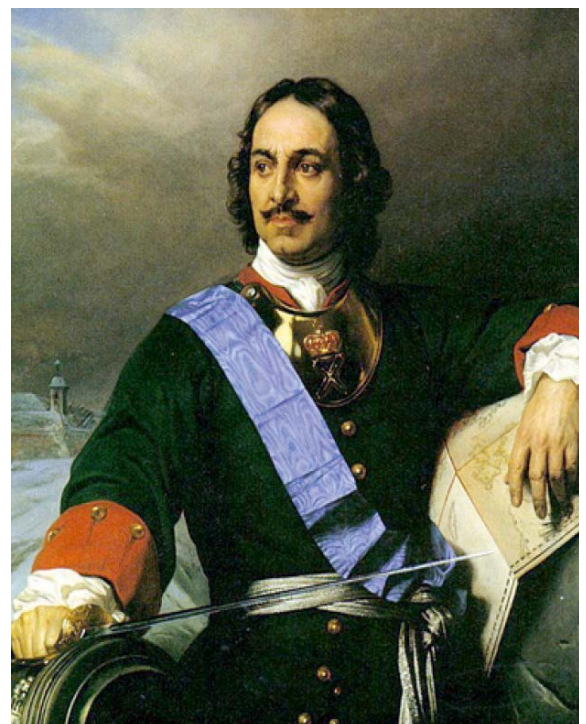
▲ Fig. 1 : Pierre le Grand par Paul Delaroche (1797-1856) musée des Beaux Arts de San-Francisco.

En 1710 le titre de dentiste est introduit en Russie. L'enseignement de l'art dentaire s'élargit dans le cadre