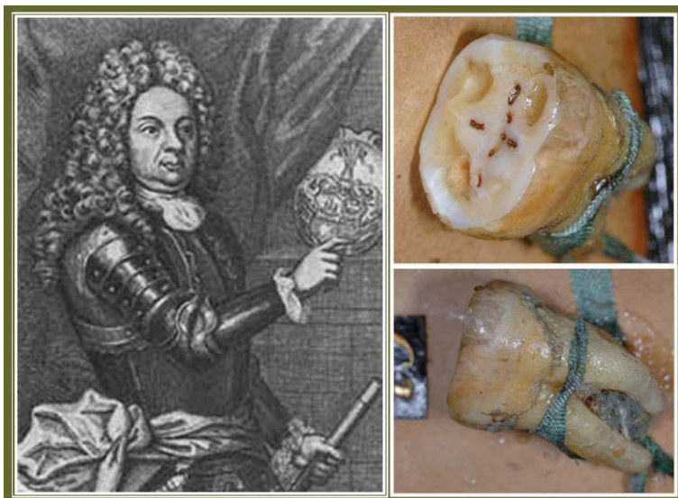
▲ Fig. 6 : Apraksin F. M. et sa dent arrachée le 3 juillet 1722.