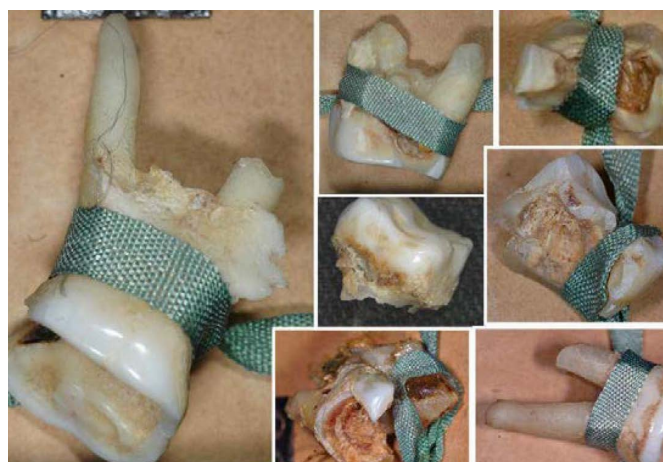
▲ Fig. 3 : Fracture de la racine (7 dents)

des cours de chirurgie. Cette année-là, le Français François Dubrel, reçoit, le premier, le droit de pratiquer l'art dentaire en Russie. Il est à noter que Pierre le Grand lui-même est un remarquable dentiste. Il sait arracher les dents et est heureux lorsque cette occasion se présente. Il porte toujours une trousse d'instruments chirurgicaux contenant des leviers dentaires et un pélican. À Saint-Petersbourg, au musée de l'Anthropologie et de l'Ethnographie, se trouve le « Registre des dents arrachées par l'empereur Pierre I er ». Dans la collection, il y a 64 dents arrachées personnellement par Pierre I er . Jusqu'à ces derniers temps, cette collection n'était qu'un exemple historique d'un des caprices du tsar russe ; on pouvait lire aussi parfois que Pierre arrachait des dents tout à fait saines pour son propre plaisir. Pendant 300 ans, l'étude scientifique de cette collection n'a pas été faite.